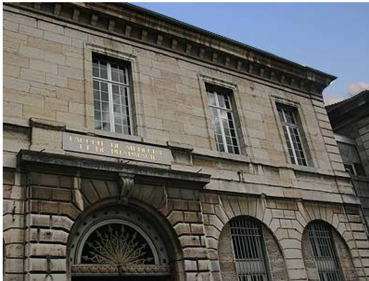
Direction des Relations internationales et de la Francophonie place Saint-Jacques, BESANCON